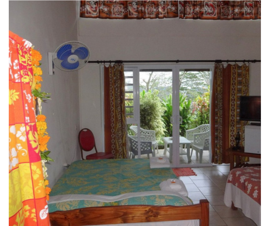
1 lit grand king size et un petit lit