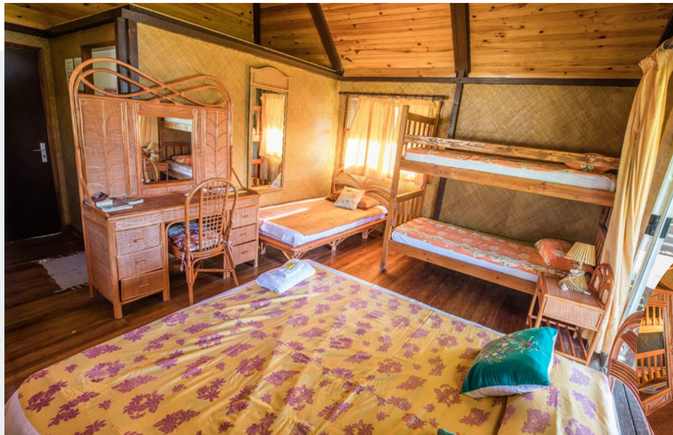
1 lit grand king size, 1 lit superposé, et 1 petit lit