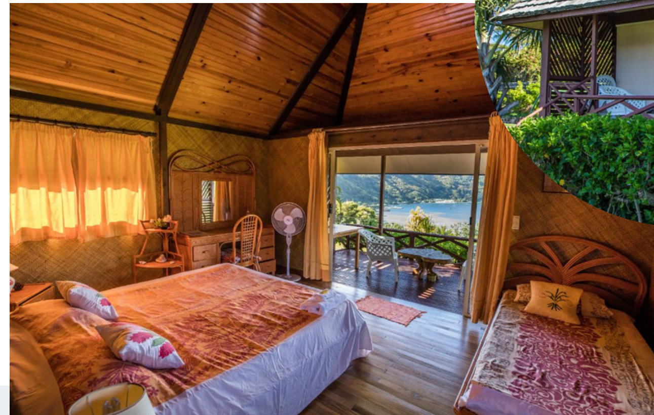
1 lit grand king size, et 1 petit lit