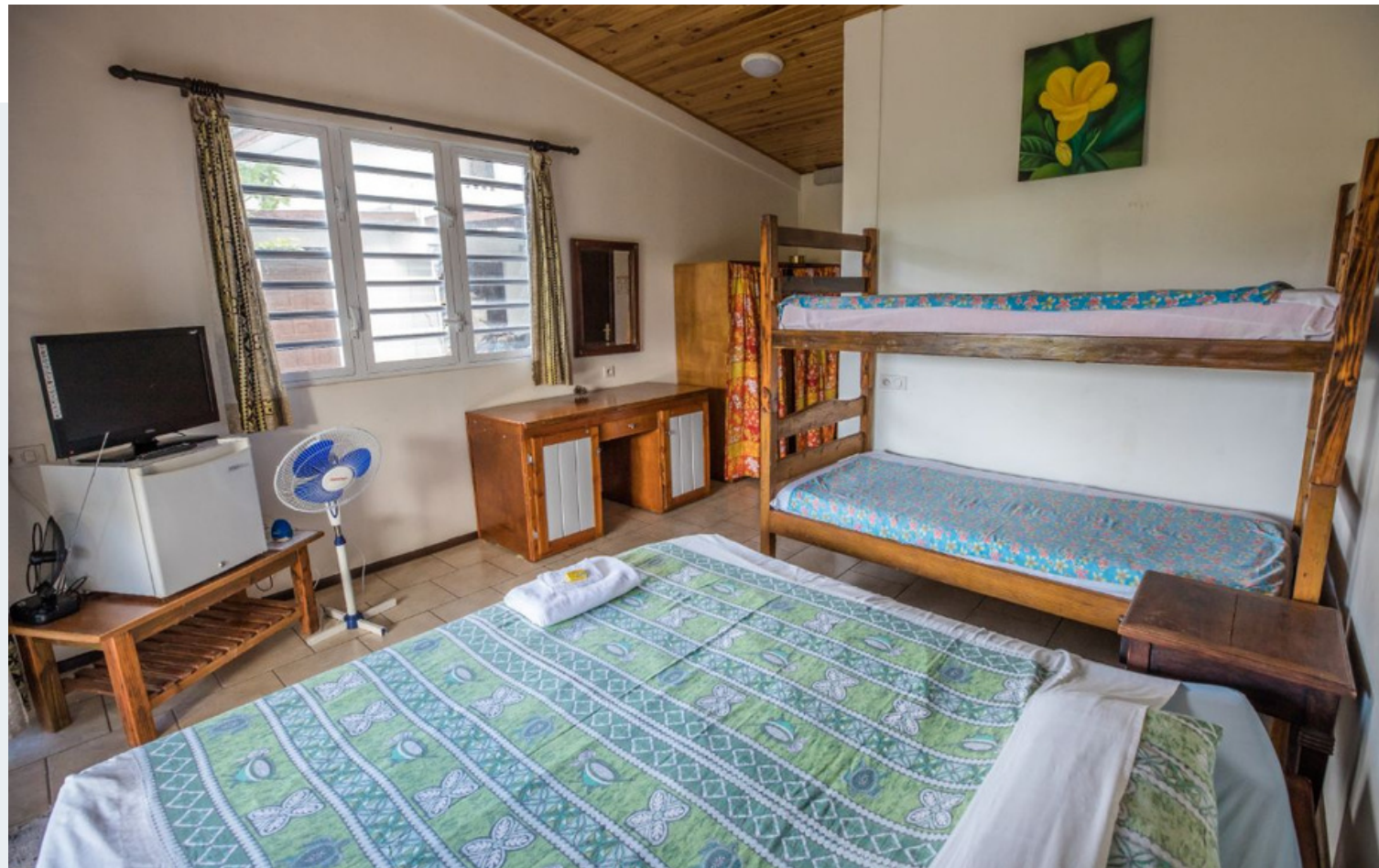
1 lit grand king size, 1 lit superposé et 1 petit lit